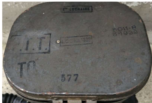
Les marquages se retrouvent sur la cartouche et sur le couvercle de la boîte.