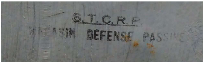
Marquage de la S.T.C.R.P - magasin défense passive sur le fond d'une boîte.